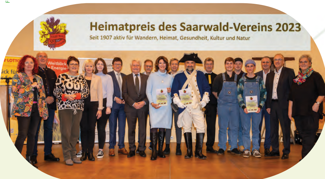
Preisträger Heimatpreisverleihung 2023

Der Saarwald-Verein ruft zur regen Beteiligung auf, um die Vielfalt und die besonderen Facetten der saarländischen Heimat sichtbar zu machen und das ehrenamtliche Engagement angemessen zu würdigen.